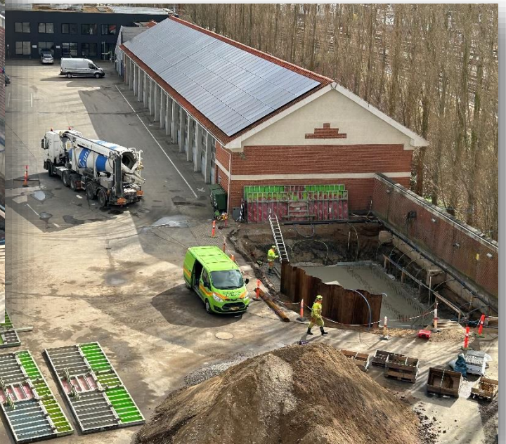
Nyt sandvaskeranlæg på Vejle Renseanlæg