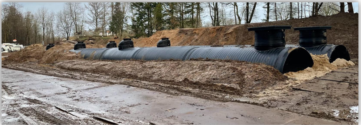
Nyt rørbassin ved det gamle Børkop Renseanlæg

Onsdag den 5. februar 2025 kl. 8.00 - 10.30