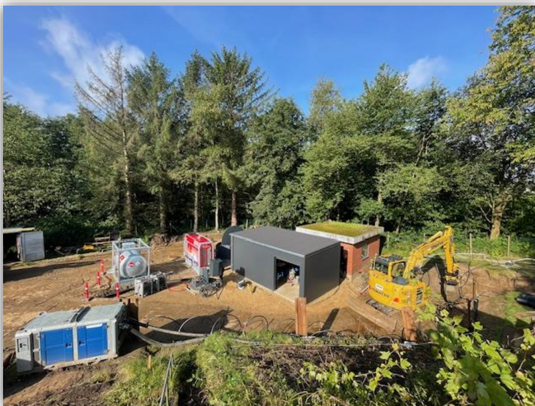
Ny pumpestation i Børkop

Tirsdag den 5. november 2024 kl. 8.00 - 10.30